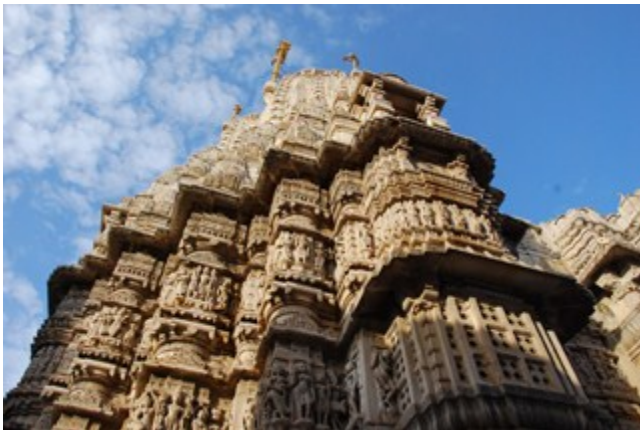
วัด Jagdish Temple

จากนั้น ปล่อยให้เวลาเดิน Shopping ชื้อของบริเวณหน้าพระราชวัง