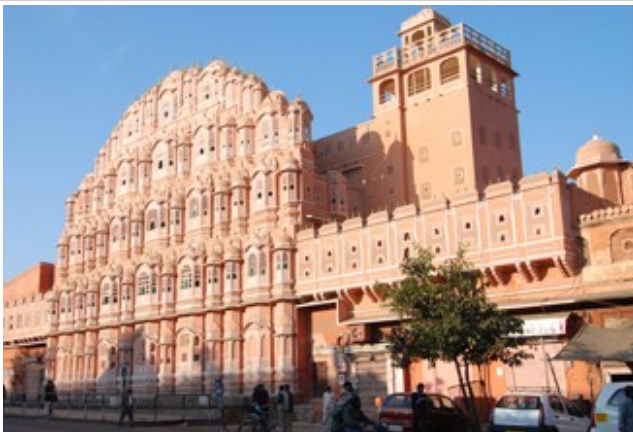
วังสายลม Hawa Palace - ชัยปุระ

นครชัยปุระ (Jaipur) นครแห่งชัยชนะ หรือ “นครสีชมพู” ชัยปุระเป็นเมืองหลวงของรัฐราชสถาน ซึ่งได้รับการออกแบบวางผังเมืองอย่างสวยงาม เป็นเมืองที่สร้างขึ้นใหม่โดยท่านมหาราชา ไซว ชัย สิงห์ ที่ 2 เป็นชุมชนศิลปะและช่างฝีมือ มีชื่อเสียงด้านการผลิตสินค้าหัตถกรรมหลากหลายชนิด ชัยปุระได้รับสมญานาม “นครสีชมพู” (Pink City) เพราะเมืองถูกทาสีชมพูเพื่อต้อนรับการเสด็จเยือนของ Prince of Wales ซึ่งต่อมาคือ King Edward VII แห่งสหราชอาณาจักร