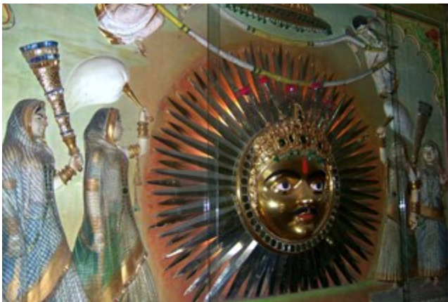
สัญลักษณ์แห่งอุทัยปุระ