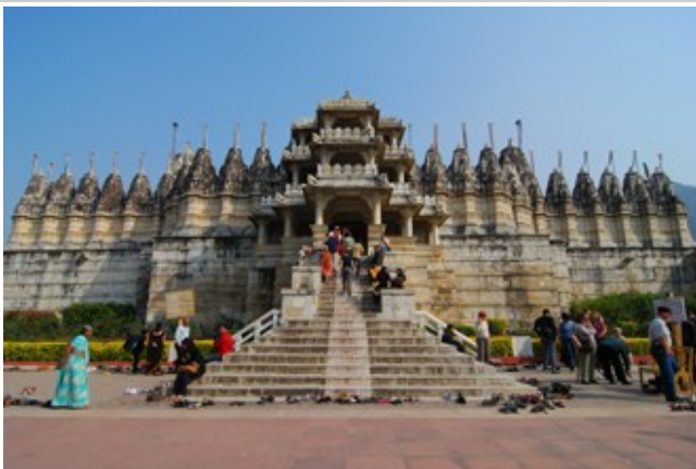
วัดเซนแห่งรานัคปุระ

เที่ยง- เดินทางถึง รานัคปุระ (Ranakpur) กินอาหารกลางวัน