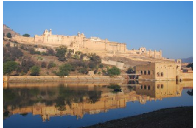
ป้อมปราการแอมเบอร์ Amber Fort - ชัยปุระ

เริ่มต้นด้วย แวะถ่ายรูปที่ พระราชวังสายลม (Palace of the Wind) วังเดิมที่ปัจจุบันตั้งอยู่ในย่านใจกลางเมือง จุดที่จะชมพระราชวังนี้ได้ดีที่สุด คือต้องข้ามถนนไปยืนชมจากฝั่งตรงข้าม