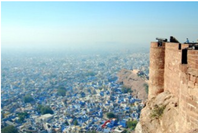
เมืองสีฟ้า - Jodhpur

โยธะปุระ (Jodhpur) นครแห่งนักรบ ถือเป็นเมืองเก่าแก่ของพวกราชบุตร เป็นต้นกำเนิดของอีกหลาย ราชวงศ์ เช่น มหาราชาแห่งบิคาเนย์ ก็เคยเป็นเจ้าของโยธะปุระ ความเก่าทำให้เมืองนี้ มีมนต์ขลัง เป็น ศูนย์กลางของชาวราชสถาน ตั้งแต่อดีตกาลนานหลายร้อยปี