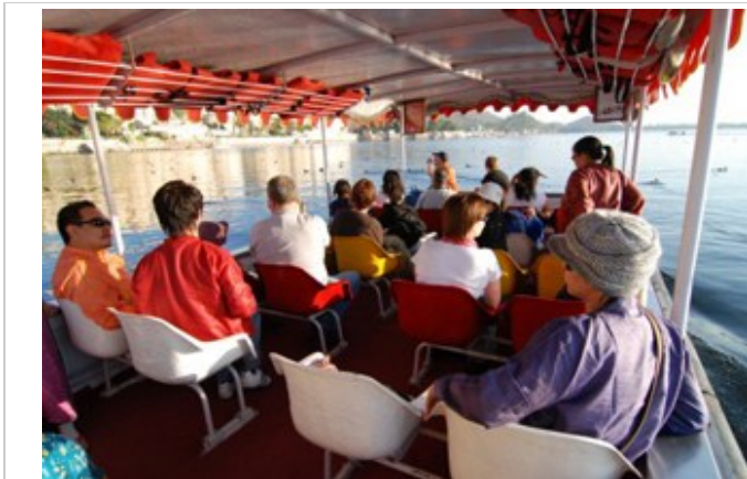
ล่องเรือเที่ยวทะเลสาบพิโคลา - Udaipur

เมืองอุทัยปุระ (Udaipur) สร้างขึ้นราวกลางศตวรรษที่ 15 ตั้งชื่อเมืองตาม มหารานาอุทัย สิงห์ ที่ 2 ผู้สถาปนาเมือง ซึ่งเป็นมหารานาผู้สืบเชื้อสายมาจากราชวงศ์ซิโซเดีย (Sisodia ที่ครองอาณาจักรเมวาร (Mewar) มาอย่างต่อเนื่องหลายร้อยปี และเป็นราชวงศ์ที่นับได้ว่าเป็นความแข็งแกร่งที่สุดในบรรดากลุ่มเจ้าเชื้อสายราชบุตร ด้วยกัน ด้วยว่าไม่ยอมก้มหัวให้ผู้รุกรานต่างชาติ ทั้งยังสามารถยืนหยัดต่อสู้กับจักรวรรดิโมกุลได้อย่างยาวนาน