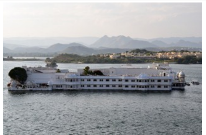
Lake Palace ในทะเลสาบพิโคลา