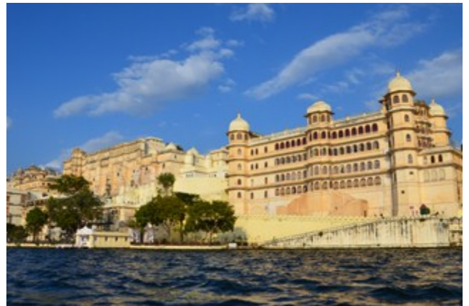
City Palace มองจากทางทะเลสาบพิโครา