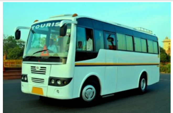
รถปรับอากาศ สำหรับคณะนี้

จากนั้นขึ้นรถปรับอากาศ เข้าสู่โรงแรมที่พัก รับชานอนเก็บแรงไว้ไปสัมผัสเสน่ห์ของอินเดียแบบเต็มๆในวันรุ่งขึ้น