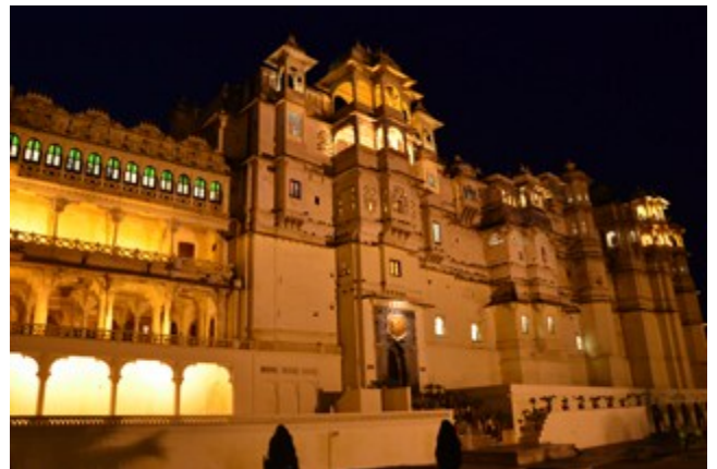
พระราชวัง City Palace ยามค่ำคืน