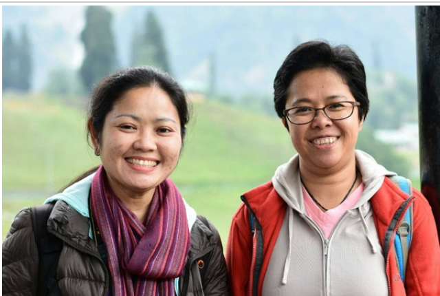
นัย' ปลา' Tour Leader พาเที่ยว