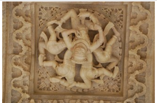
วัดเซนแห่งรานัคปุระ

บ่าย- ไปเดินเที่ยวชม วัดเซน (Jain Temple) ให้เต็มอิ่ม